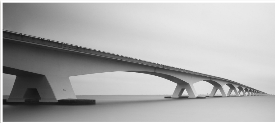
Formazione a distanza by Enrico Tafelli